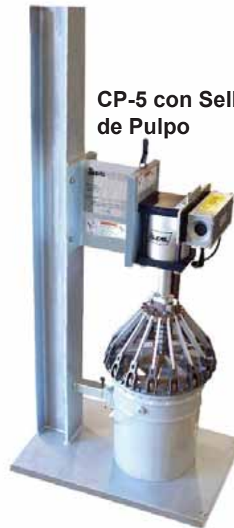
CP-5 con Selladora de Pulpo

Esta herramienta semiautomática de cerrado provee la presión para cerrar cubetas plásticas y metálicas tipo U.N. Las herramientas de cerrado se cambian muy fácilmente con los pines de salida rápida. La unidad puede usarse como se muestra arriba o puede ser montada en una línea transportadora como se muestra al reverse de esta página.