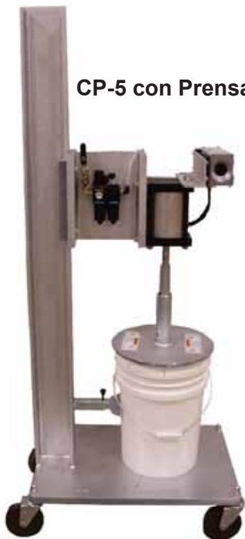
CP-5 con Prensa